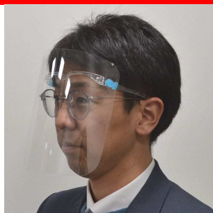
フェイスシールド