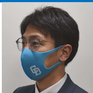
ウレタン製マスク