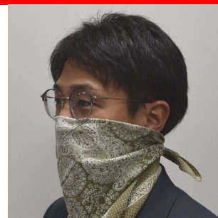
バンダナ・タオル等