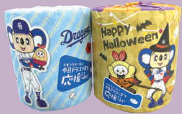
トイレットペーパー (イオンリテール)

※ノベルティを制作する場合は、キャンペーン費用が別途発生します。 ※実例は全てイメージです。 ※ノベルティには「©中日ドラゴンズ」を入れてください。 ※企業ロゴがある場合はロゴを入れてください。