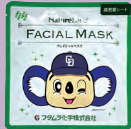
フェイシャルマスク (フタムラ化学)