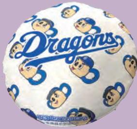
クッション (UCSカード)