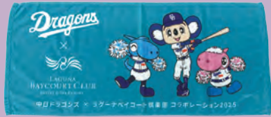
タオル (ラグーナベイクート倶楽部)