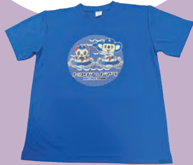
Tシャツ (ポートレースとこなめ)